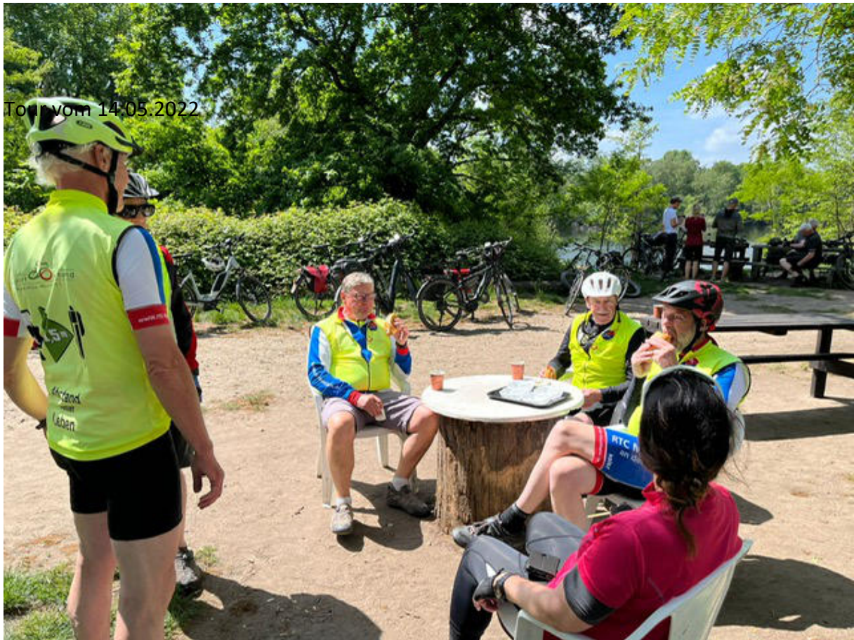
Pause beim Entenfang