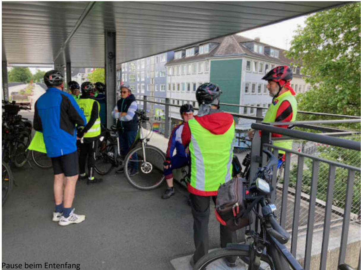
Pause beim Entenfang