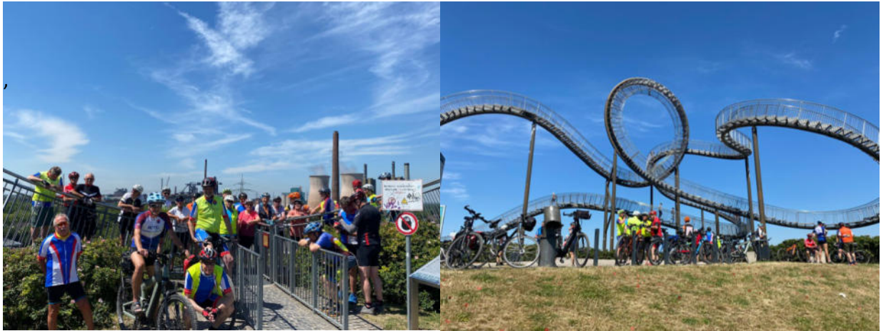
Das Wetter war sehr angenehm, die Stimmung bestens, der Fahrernuss optimal. (Text: Wolf Pick)